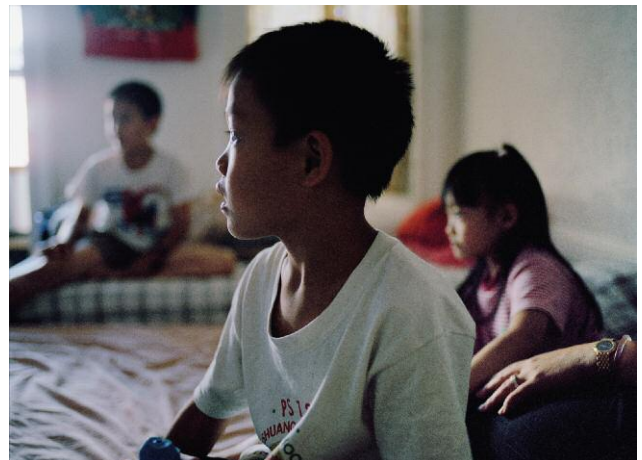
04_Afternoon TV