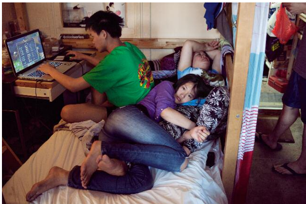
11_Spring Break