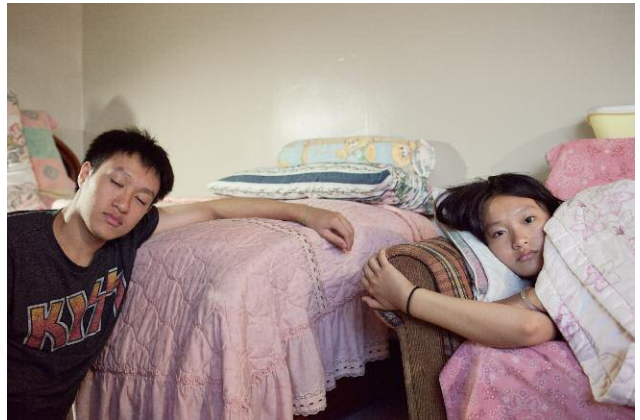
10_Five Days Before College ©Thomas Holton