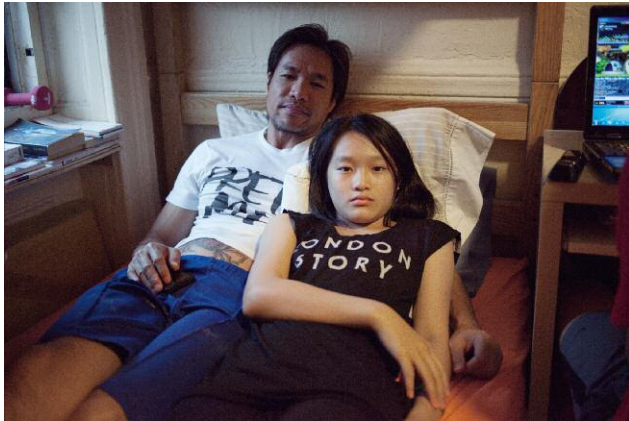
01_A Father's Touch