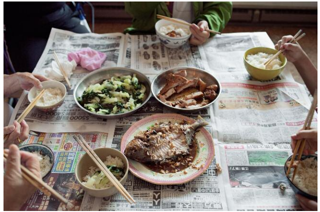
08_Dinner for Seven