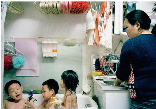
05_Bath Time