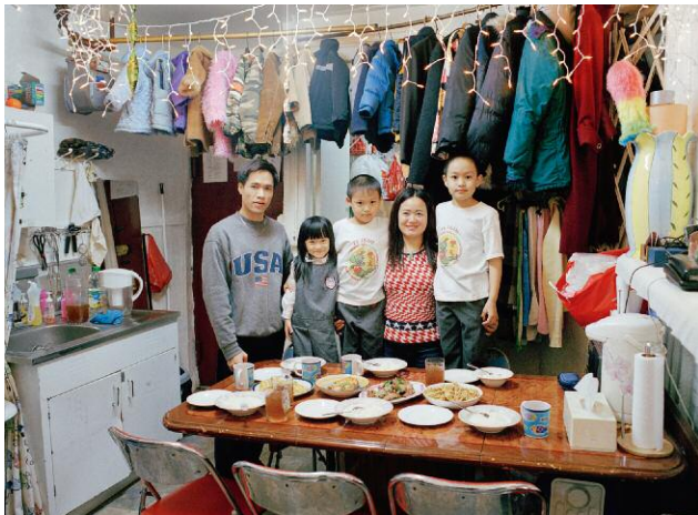
09_Family Portrait