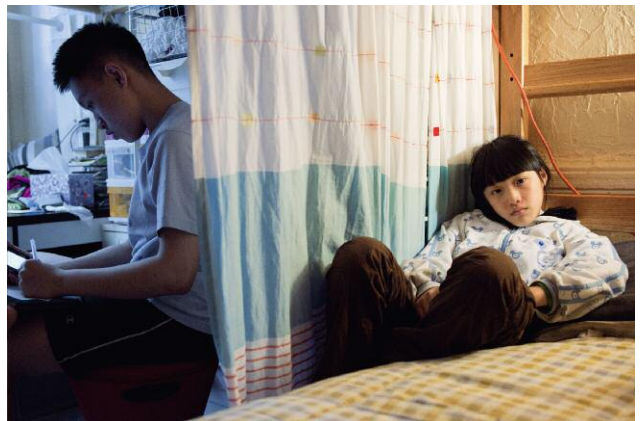
12_Waiting For Dinner