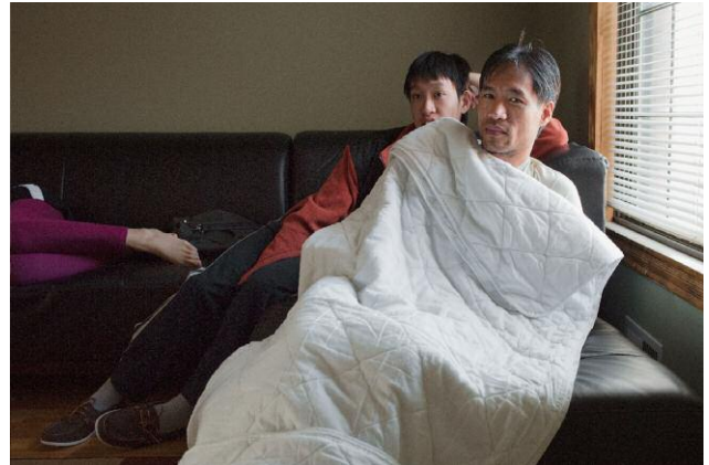
02_A Sunday Visit