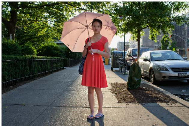
03_After Swimming