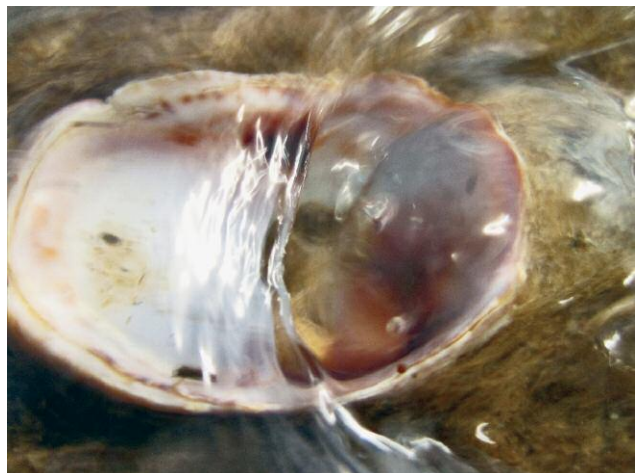
10_Unter der Haut des Wassers, Kehrer