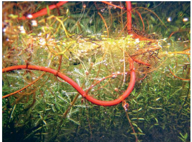
2_Unter der Haut des Wassers, Kehrer