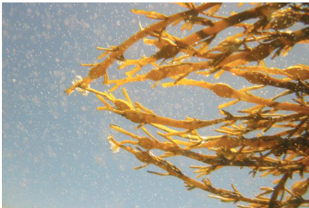
9_Unter der Haut des Wassers, Kehrer © ULRIKE CRESPO