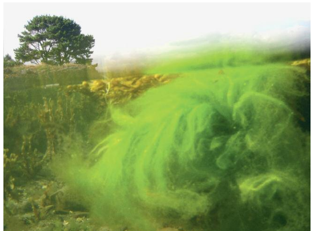
4_Unter der Haut des Wassers, Kehrer