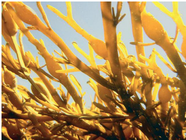
3_Unter der Haut des Wassers, Kehrer