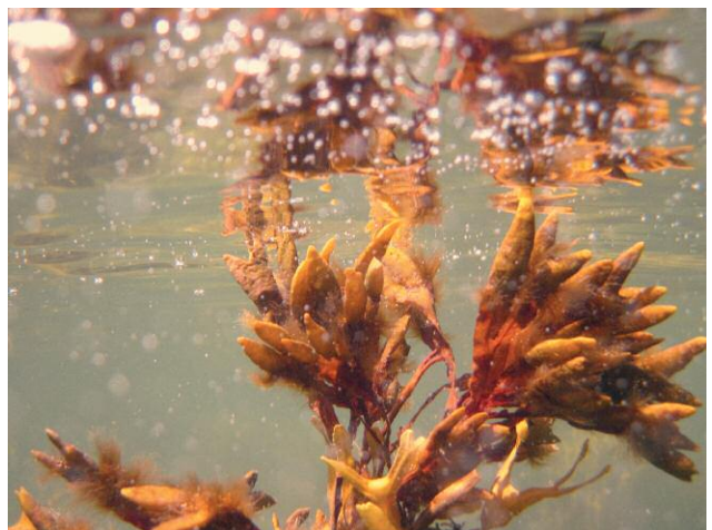
6_Unter der Haut des Wassers, Kehrer