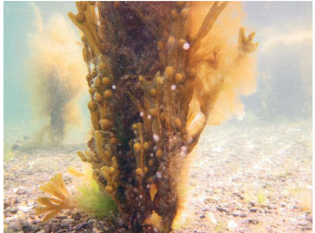
8_Unter der Haut des Wassers, Kehrer