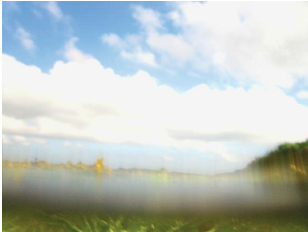
7_Unter der Haut des Wassers, Kehrer