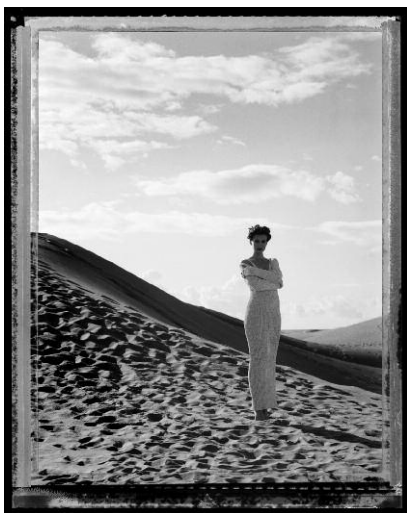
10_Werner Mahler: Modefoto für die Zeitschrift „Sibylle“, 1994. Polaroid 4x5 inch. © Werner Mahler