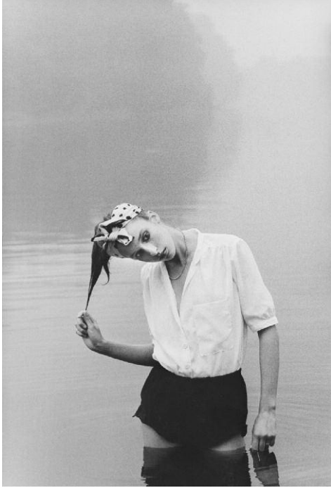
12_Ute Mahler: Modefoto für „Sibylle“, Julia Koberstein, Model, Berlin, DDR, 1979. © Ute Mahler