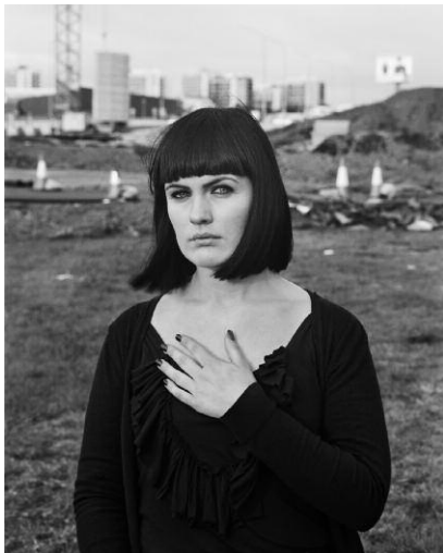
8_Ute Mahler; Werner Mahler: Aus der Serie „Monalisen der Vorstädte“ Adda, Reykjavik, 2009.