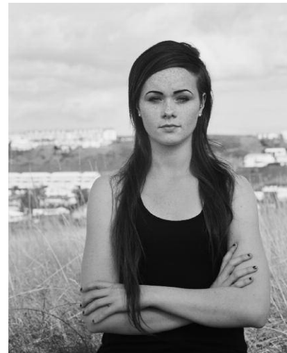
9_Ute Mahler; Werner Mahler: Aus der Serie „Monalisen der Vorstädte“ Birna, Reykjavik, 2009.