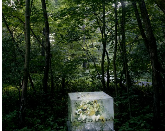
1_Ute Mahler; Werner Mahler: o.T. # 10. Aus der Werkgruppe »Die seltsamen Tage«, seit 2010.