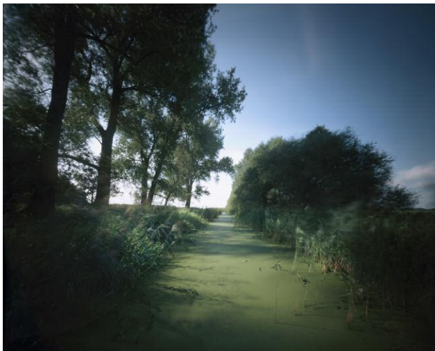
4_Werner Mahler: Rhinluch bei Linum, Land Brandenburg, Sommer 2000. Aus der Werkgruppe »Landschaft 3«, 2000.