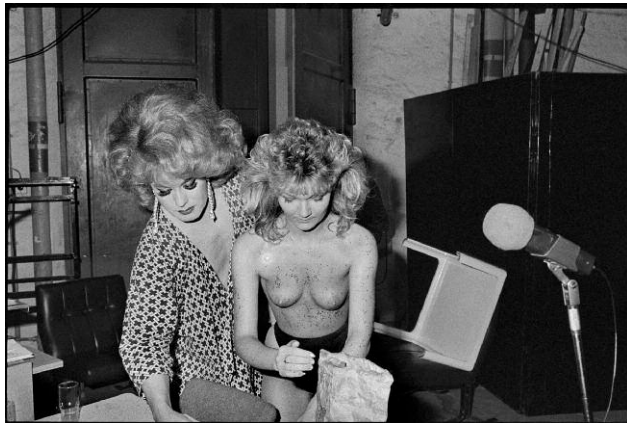
2_Ute Mahler: Erotik-Show, Stadthalle Karl-Marx-Stadt, heutiges Chemnitz, 1988. Aus der Serie »Erotikprogramm«.