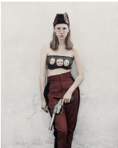
5_Bulletproof, Kehrer Verlag