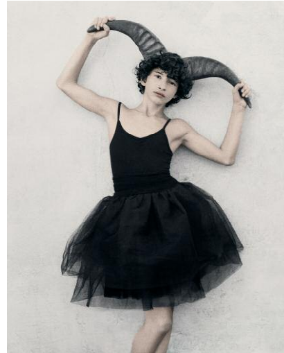
2_Bulletproof, Kehrer Verlag © VEE SPEERS, 2014