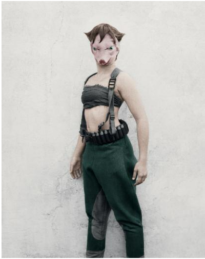
7_Bulletproof, Kehrer Verlag © VEE SPEERS, 2014