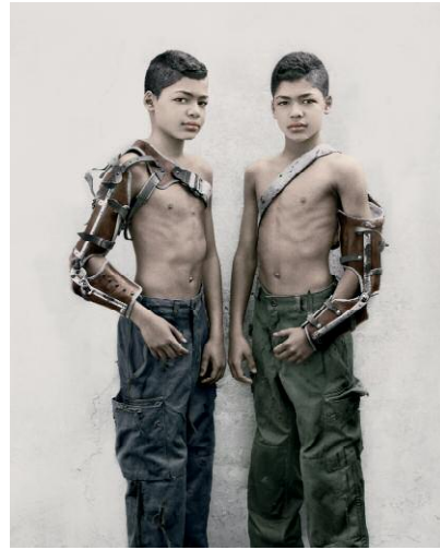
8_Bulletproof, Kehrer Verlag