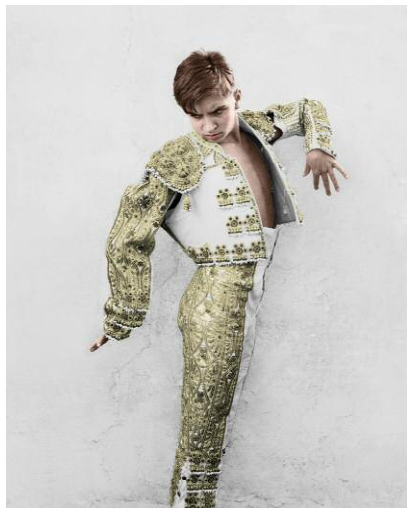
3_Bulletproof, Kehrer Verlag