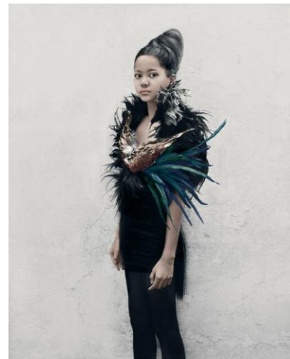
4_Bulletproof, Kehrer Verlag © VEE SPEERS, 2014