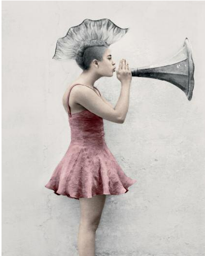
1_Bulletproof, Kehrer Verlag © VEE SPEERS, 2014