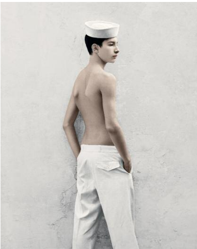
9_Bulletproof, Kehrer Verlag © VEE SPEERS, 2014