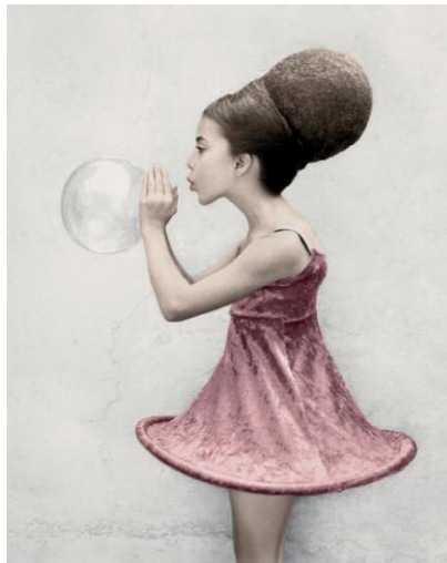
10_Bulletproof, Kehrer Verlag © VEE SPEERS, 2014