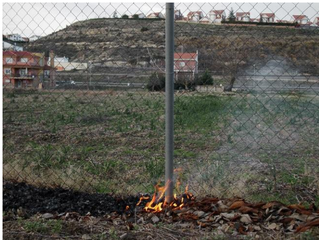
3 © Yorgos Karailias