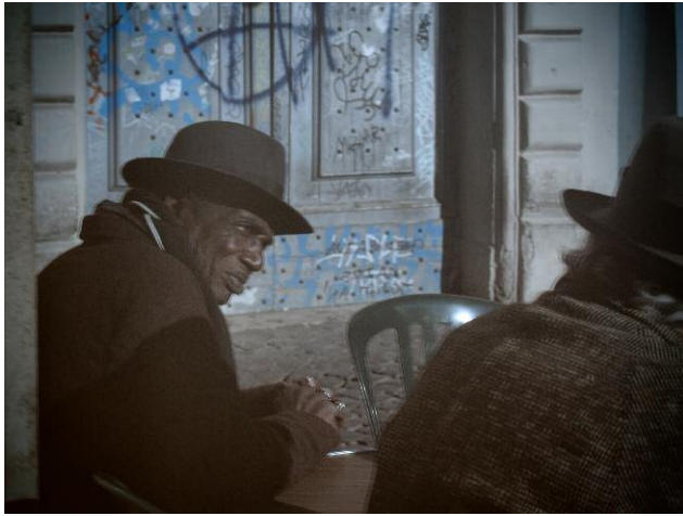
7 © Yorgos Karailias