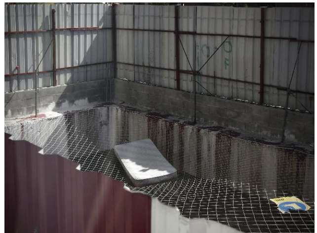
4 © Yorgos Karailias