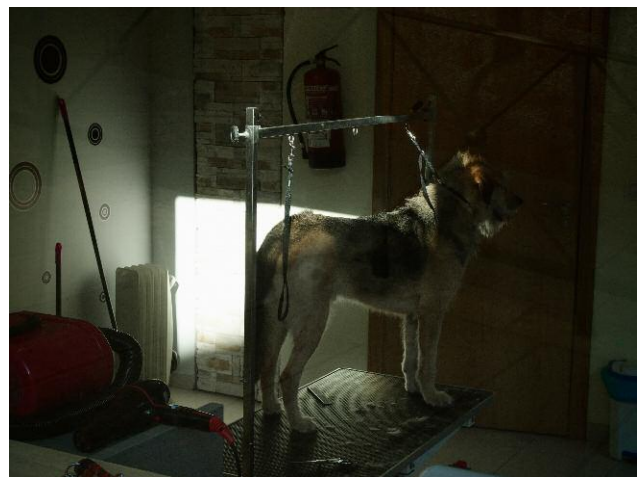
12 © Yorgos Karailias