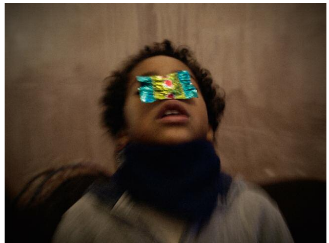
10 © Yorgos Karailias