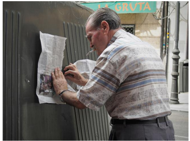
2 © Yorgos Karailias