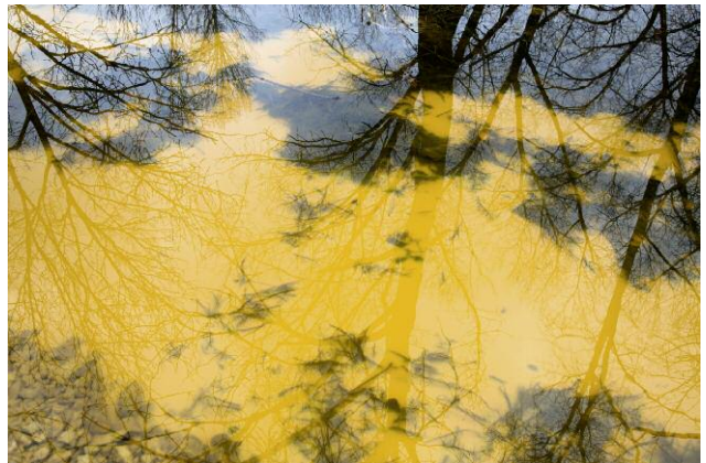
Pressebild 4