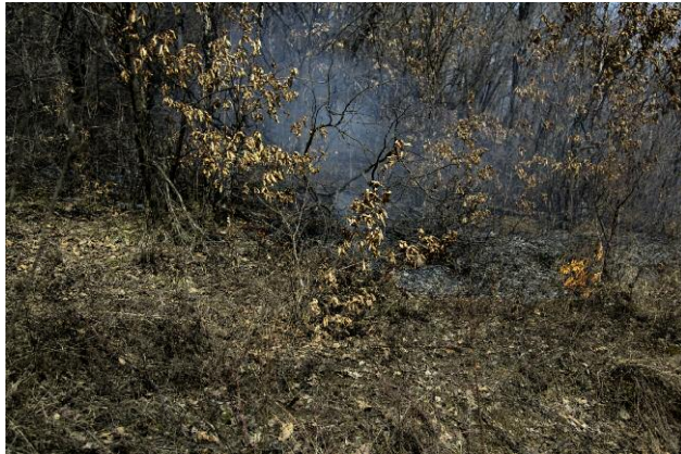
Pressebild 9