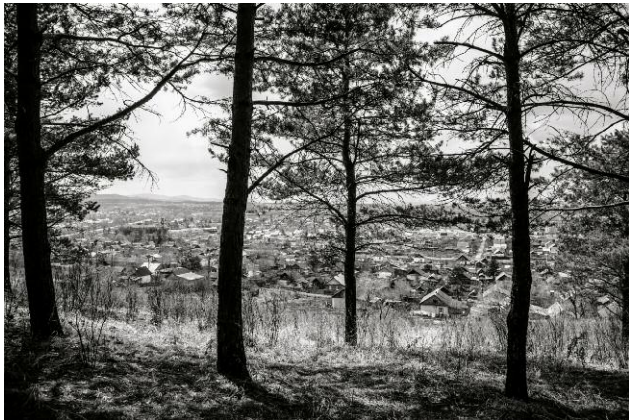
Pressebild 3