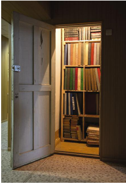
Pressebild 7