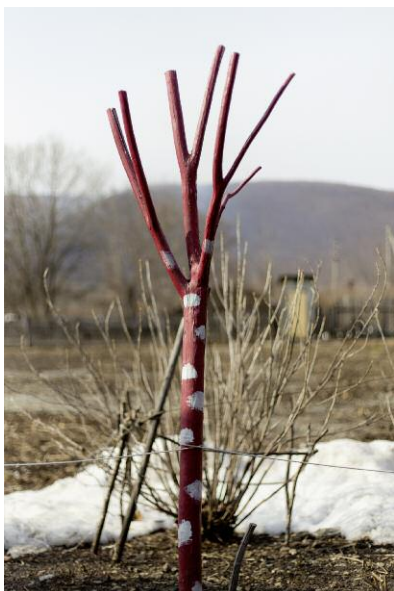
Pressebild 5