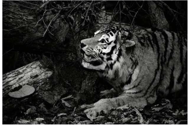
Pressebild 2