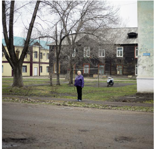
Pressebild 8