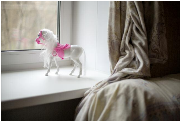
Pressebild 1 © Yury Toroptsov