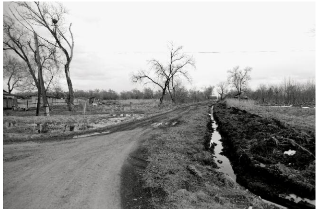
Pressebild 10