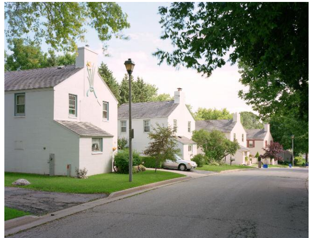
4 Daffodil House, GREENDALE, WISCONSIN