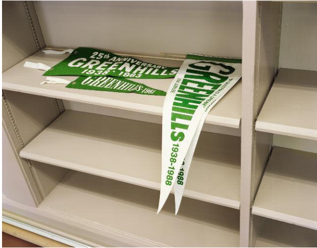
7 Anniversary Pennants, GREENHILLS, OHIO