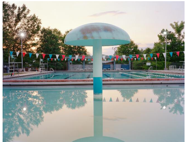
6 Mushroom, GREENBELT, MARYLAND