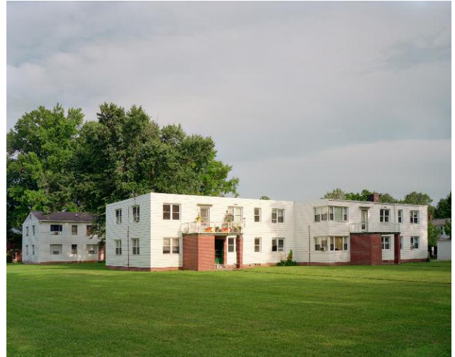
2 Farragut House, GREENHILLS, OHIO