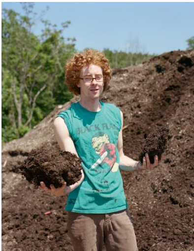
9 Teen with Compost, GREENBELT, MARYLAND