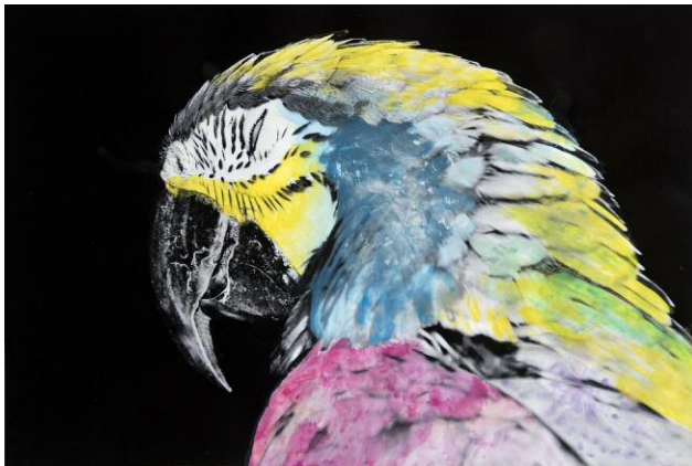
7. The parrot with its squinting eye half open was the beginning of the project; a 'tropical' symbol for colors. It was later colored by an achromatope not aware of which colors she was using (yet applying them quite correctly).