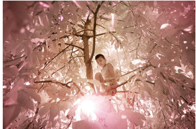
2. Jaynard (achromatope) climbs a tree in the garden, to pick fruits and play. I took the picture while he was climbing back down. The sun comes peeking through the branches; bright light makes him keep his eyes closed. Sadly local people are often not growing their own food. But the trees around them naturally grow coconuts, breadfruit, bananas and leaves used to chew the betelnuts.