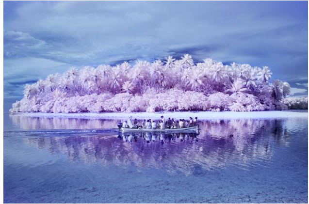
6. On the way back from a picnic to one of the uninhabited small islands around Pingelap with the colorblind Pingelapese and all the children of the one school of the island. The bay is now protected, islanders are no longer allowed to fish for turtles. Because of the infrared colors the scene looks very romantic, at the same time there's the visual connotation of the boats full of refugees setting off for a better future.