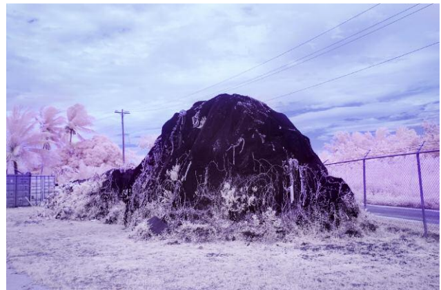
4. A pile of fishing nets in the shape of a mountain close to the domestic airport in Pohnpei from where the tiny airplane (carrying 4-6 people) sets off to Pingelap.