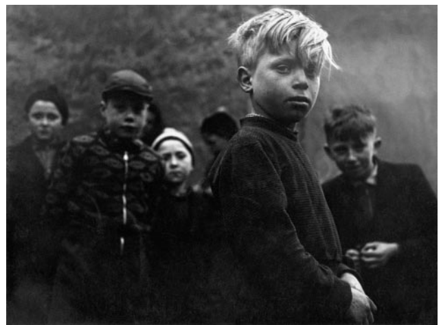
18_ Ernst des Lebens: Seine Bande (Originaltitel), Aachen, 1954 © Horst H. Baumann