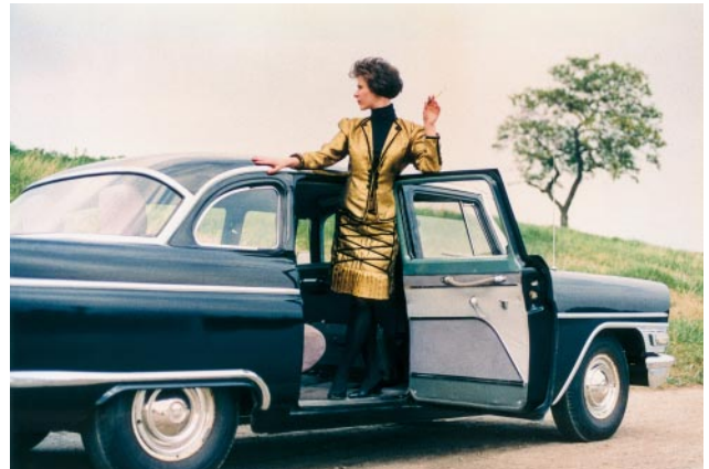
12_Schick im Tschaika: Modefoto mit ausgerangierter Regierungskarosse für die Diplomarbeit der Leipziger Designerin Gabriele Frauendorf, Bratislava, Ende der 1980er-Jahre / late 1980s