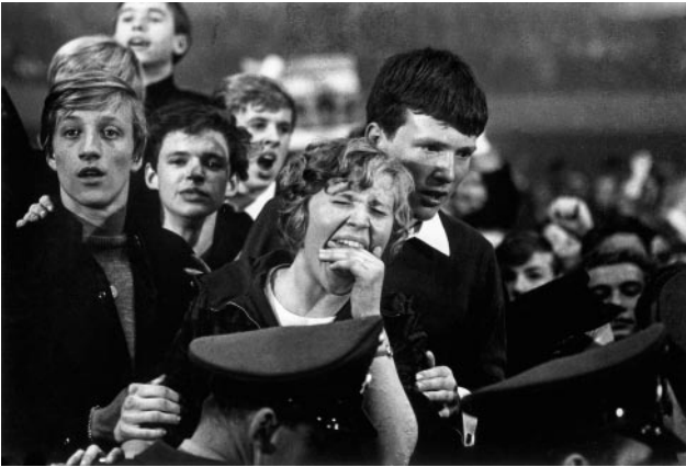
07_Fans bei einem Konzert der Rolling Stones in der Münsterlandhalle, Münster, 1965