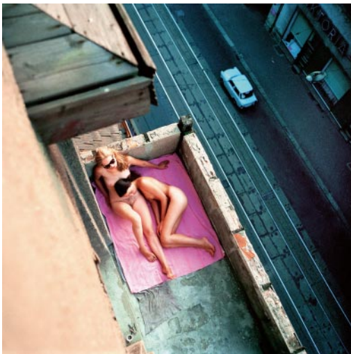
15_ Sonnenbad auf dem Balkon, Halle an der Saale, 1989