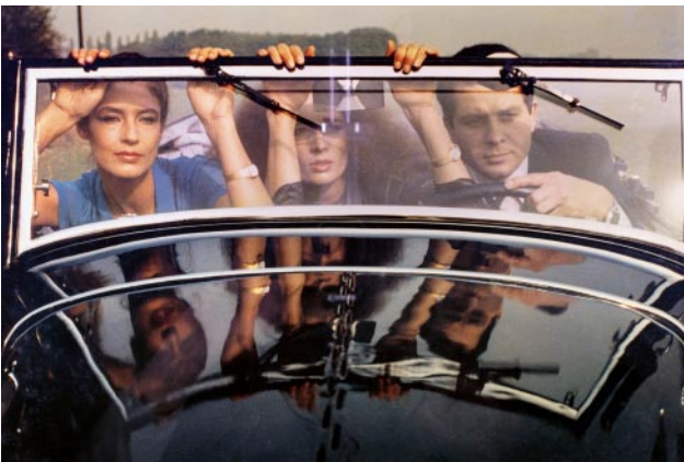
09_Präzisionsarbeit: Werbefoto für das VEB Uhrenwerk Ruhla, Ruhla, 1970