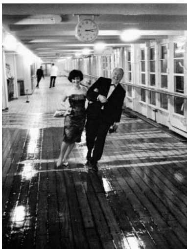
17_ Early Morning: Silvester auf der Hanseatic der Hamburg-Atlantic-Linie, auf See / on sea, 1960