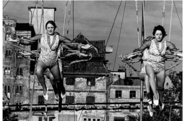
10_Trapezkünstlerinnen, Rostock, 1974