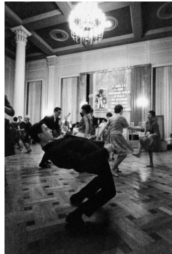
04_Später Abend: Twist auf sozialistischem Tanzparkett, Ostberlin, 1964