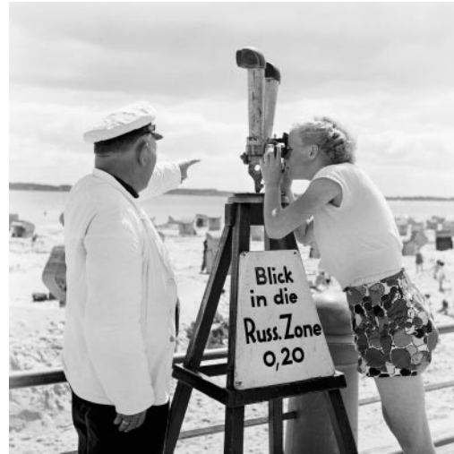
02_Blick gen Osten: Unterhaltungsprogramm am Strand der Lübecker Bucht, Travemünde, 1952