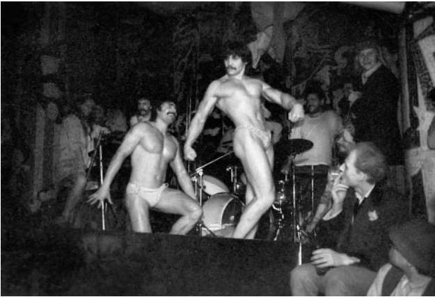
13_ Unverkleidet: Faschingsfeier vom Verband Bildender Künstler in der Zentralgaststätte, Halle an der Saale, 1987