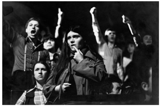
08_Fans bei einem Konzert der DDR-Rockband Puhdys, Ostberlin, ca. 1980