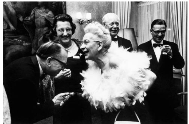
06_Empfang des Unternehmerinnenverbands, Düsseldorf, 1965