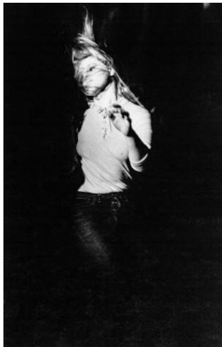
05_Ganz bei sich: Tänzerin, Ostberlin, 1972