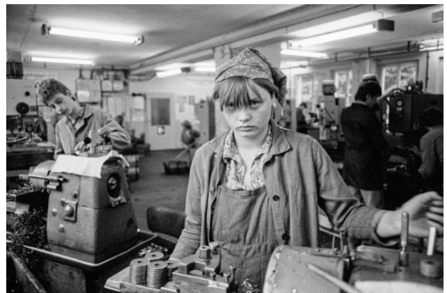
16_ Jugendwerkhof: Wer als »schwer erziehbar« galt, wurde in der DDR in solche Einrichtungen eingewiesen und streng diszipliniert. Aus einer Reportage für die Neue Berliner Illustrierte , Wolfersdorf, Thüringen, 1987