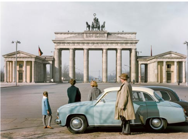
03_Blick gen Westen: Das instandgesetzte Brandenburger Tor vor dem Mauerbau – für den Autoverkehr gesperrt, für Fußgänger noch offen, Ostberlin, 1960